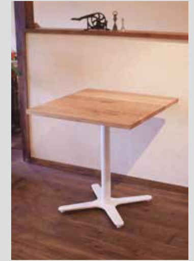
ホワイトオーク× プラス脚 (ホワイト)