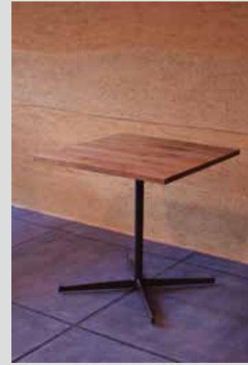
ウォールナット× クロス脚 (ダークブラウン)