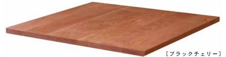
[ブラックチェリー]