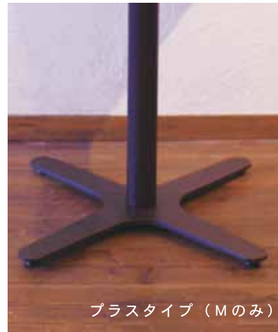
プラスタイプ (Mのみ)