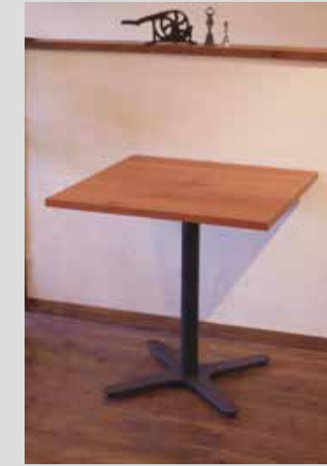
ブラックチェリー× プラス脚 (ダークブラウン)